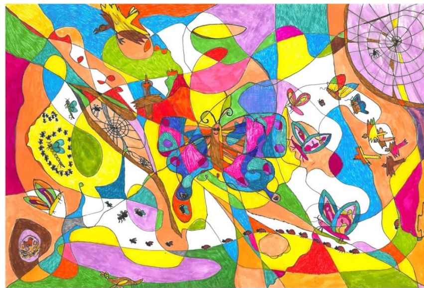
Marta Sacewicz - lat 7 i 5 miesięcy Pocięty materiał - latający świat – pisaki, mazaki