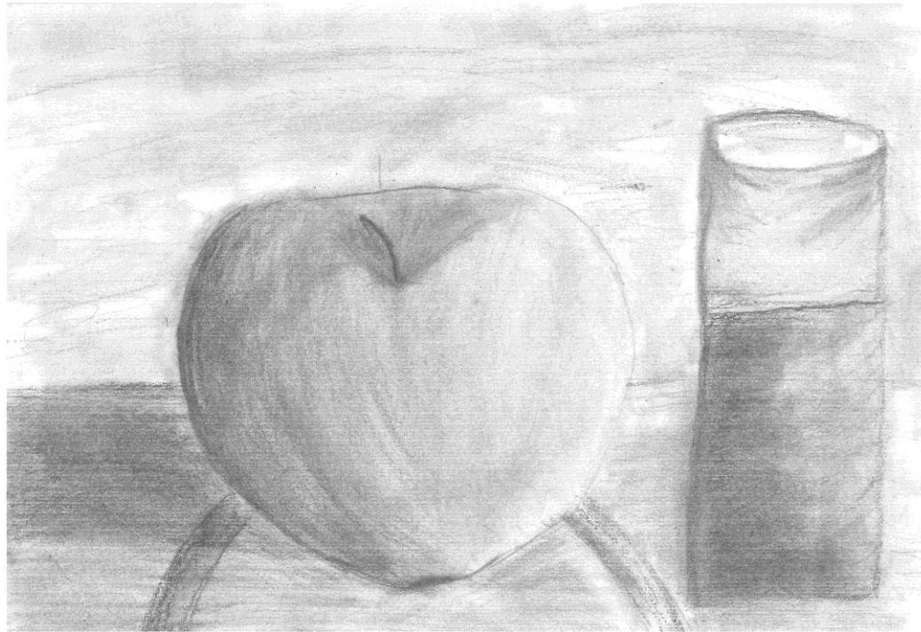
Marta Sacewicz - lat 7 i 4miesiące Jabłko - szkic ołówkiem

Marta lat 7 i 10miesiący, uczennica klasy III szkoły podstawowej, uzdolniona plastycznie