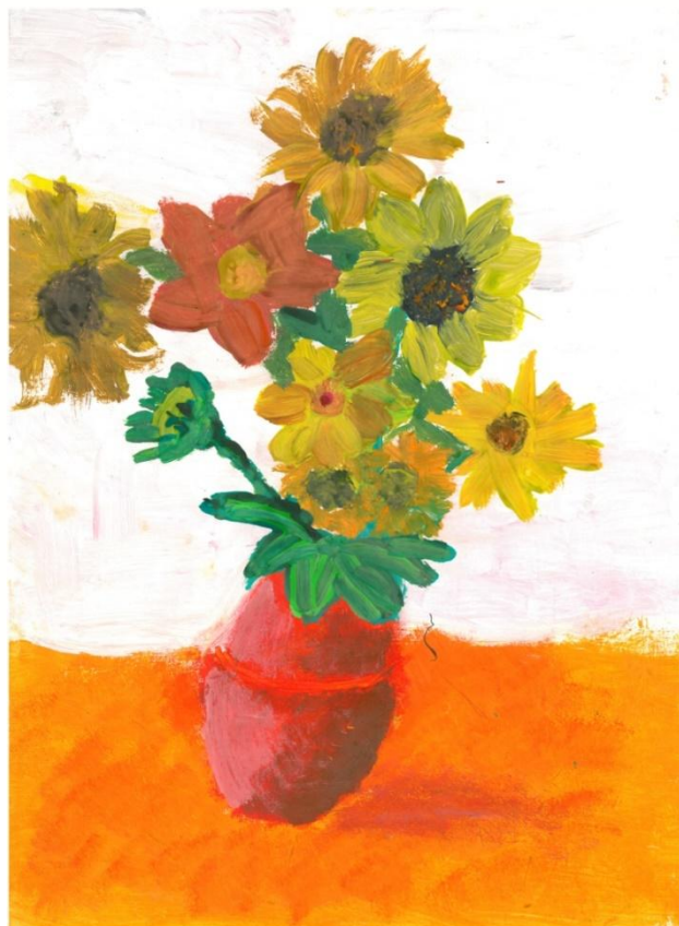
Marta Sacewicz - lat 7 i 3 miesiące Bukiet kwiatów farby plakatowe