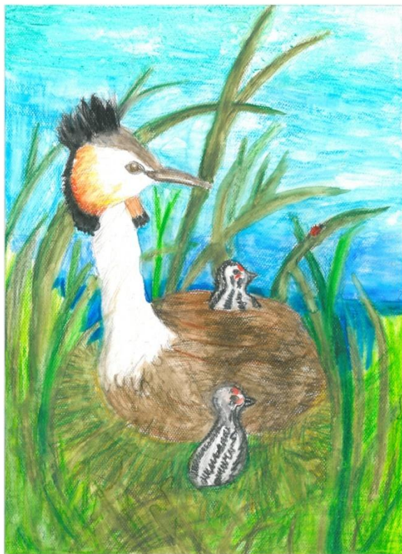
Marta Sacewicz - lat 7 Ptak - akwarele w kredkach